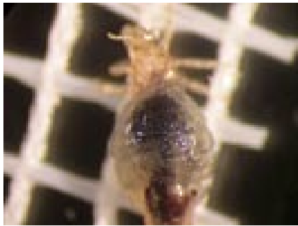
Poslije tretmana Hedrin®