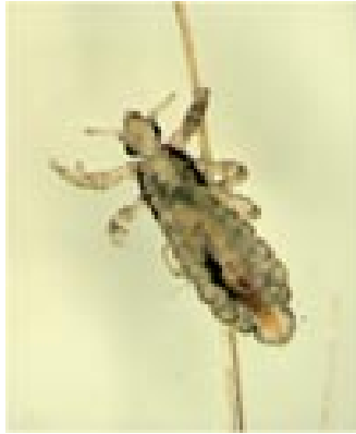
Prije tretmana Hedrin®